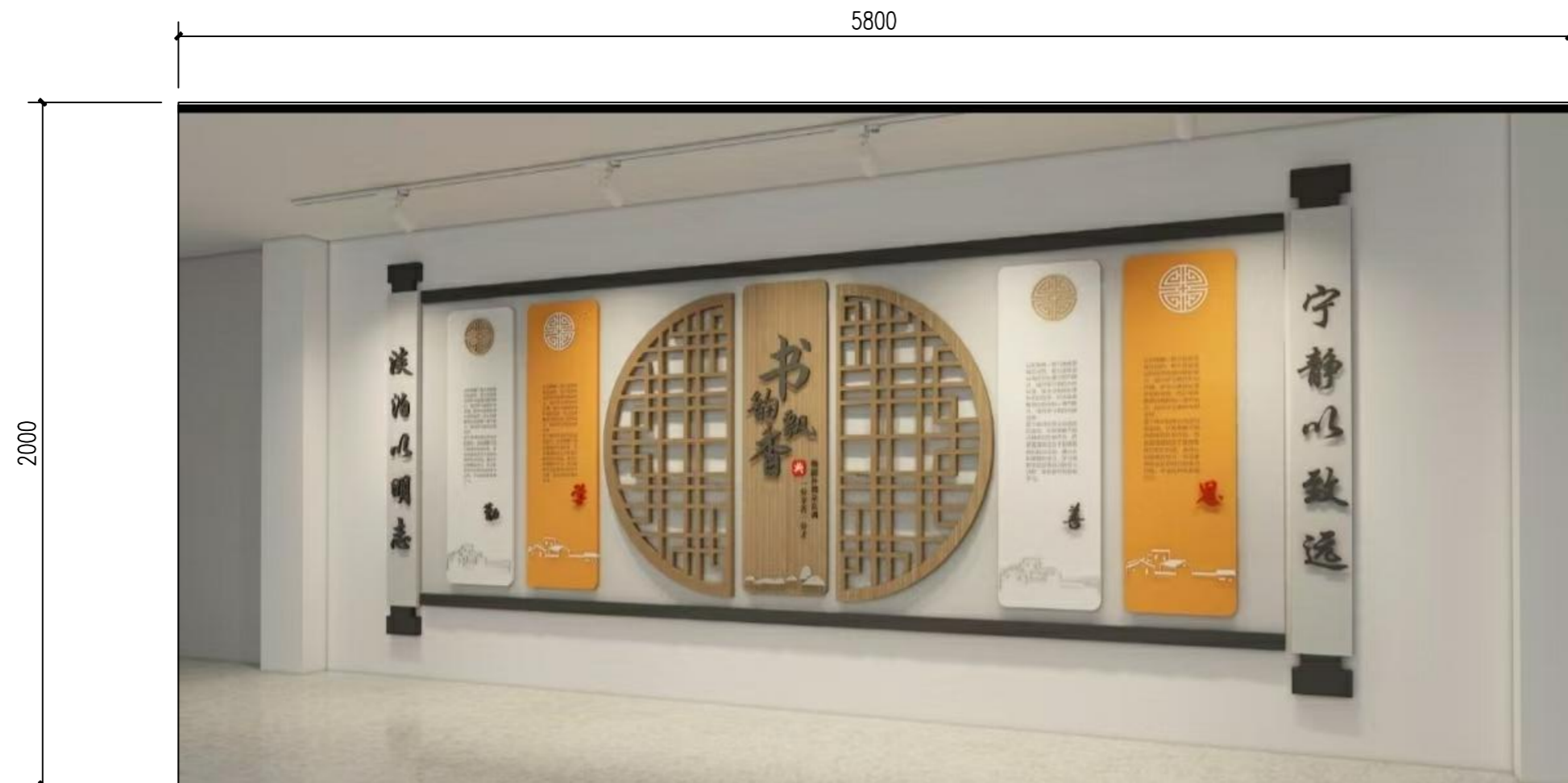
改造后：过道西墙1.5厚PVC板+ 亚克力镀膜图案示意